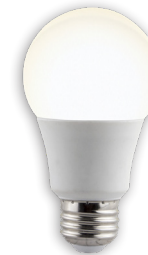
WFA19RGB1 A19 WIFI BULB AMPOULE WIFI A19 INSTRUCTIONS